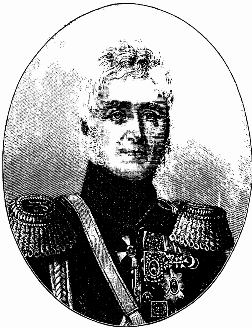
В О Р О Н Ц О В Ъ .