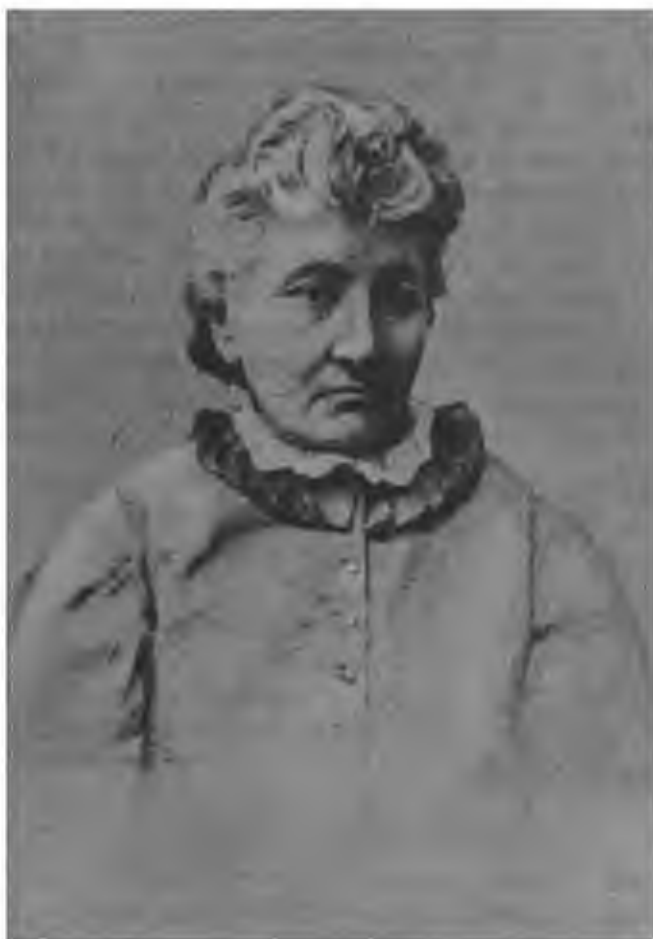
Е. К. Брешко-Брешковская. (1904 г.)